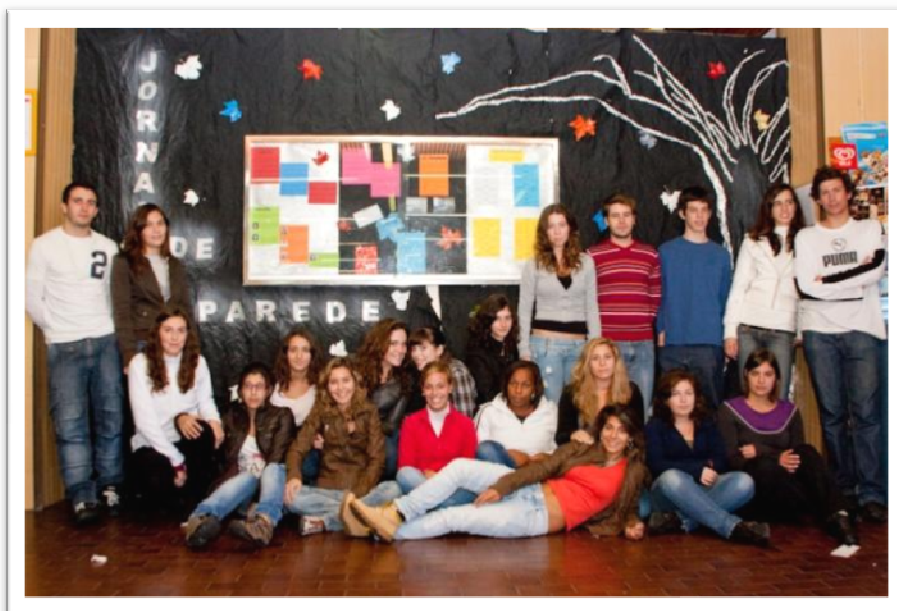
Primeira edição do Jornal de Parede

Numa tentativa de dinamização do espaço da sala de convívio pelos nossos alunos, as professoras de Português da ETLA promoveram a iniciativa da construção de um jornal de parede. O conteúdo de cada jornal é decidido pela turma e os temas abordados são do interesse dos alunos e vão desde a agenda cultural, passando pelas curiosidades e pelas notícias da escola. Cada edição do jornal é da responsabilidade de uma turma e todas as edições serão avaliadas por um júri que, no final do ano lectivo, elegerá o melhor jornal de parede.